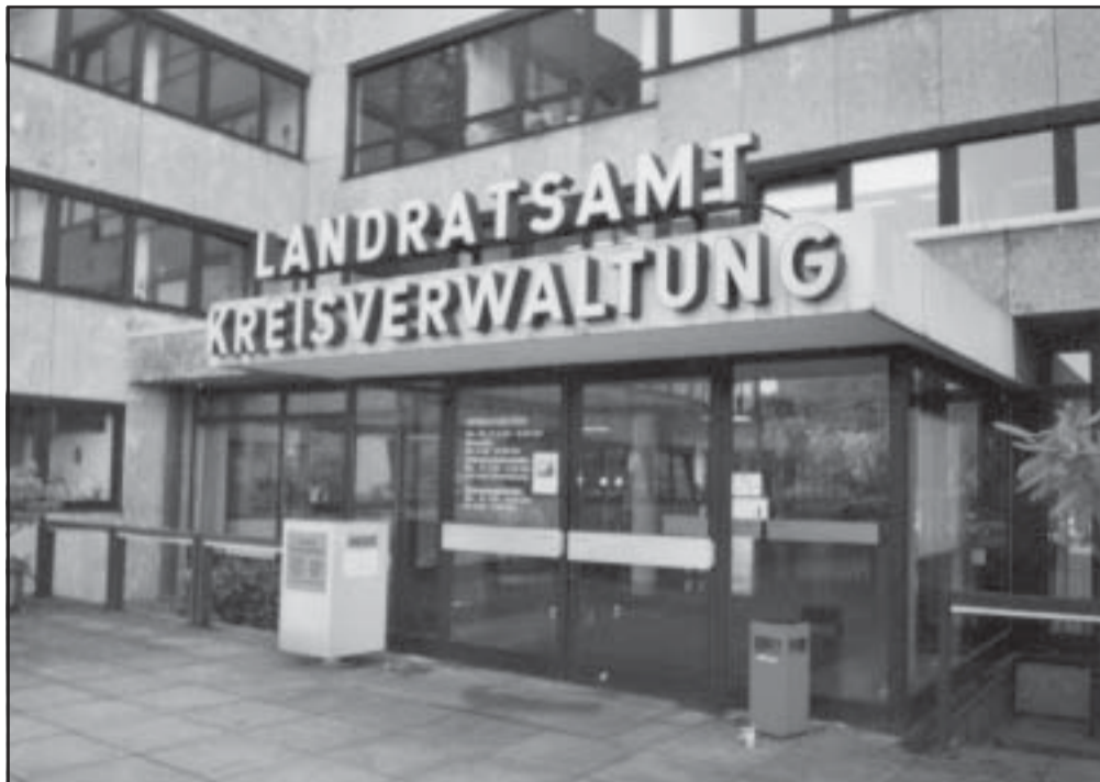
Die Immobilien des Kreises sollten dafür genutzt werden, dem Land Steuergelder von 70-80 Mio. Euro zu entziehen