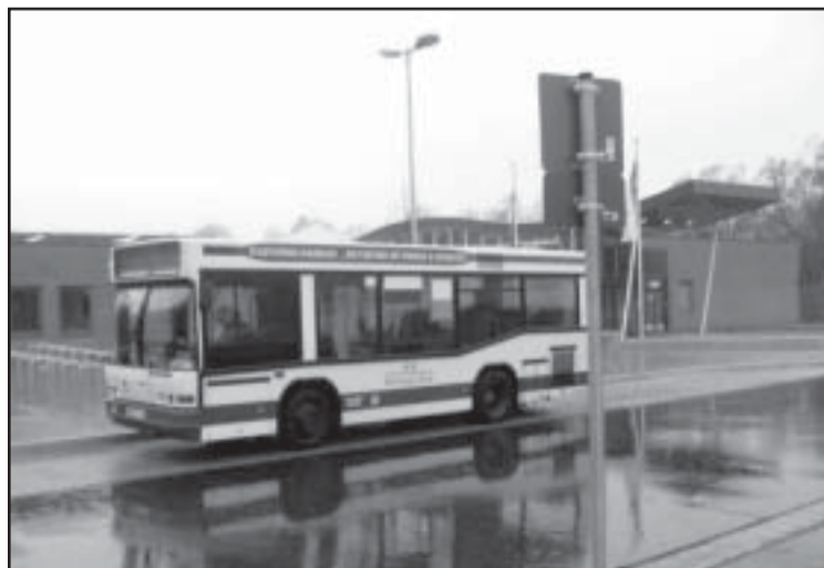
Erst wurde das Bad durch einen Bus, dann durch einen Kleintransporter bedient, jetzt wird die Verbindung ganz eingestellt. Dazu passt, dass die geplanten Parkgebühren entfallen.