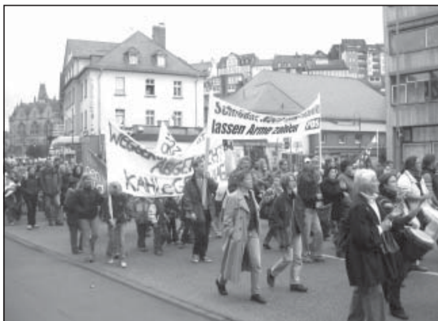
Am 10. Oktober demonstrierten 800 Menschen gegen Sozialabbau. Aufgerufen hatte die Aktion Soziale Gerechtigkeit, ein Bündnis aus 32 sozialen Initiativen und Gewerkschaften, dem auch die PDS angehört

Rot-Grün schneidet ins Marburger soziale Netz