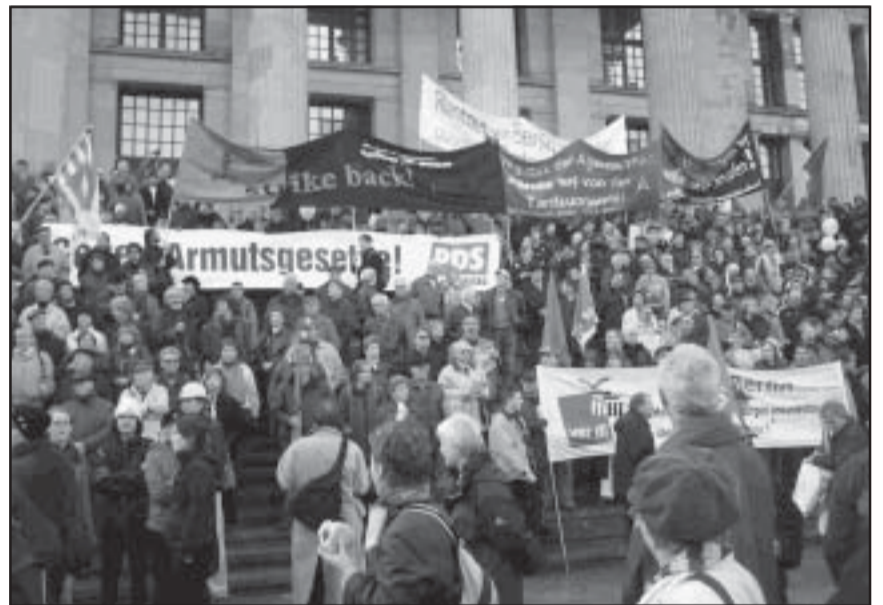
Trotz Boykott der Medien und Gewerkschaftsspitzen: 100.000 protestierten in Berlin gegen Sozialabbau