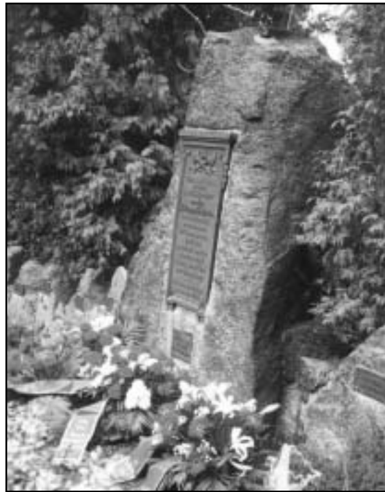
Gedenkstein für die 15 Ermordeten in Bad Thal

Auf Druck der Öffentlichkeit war es zwar zu einem Prozess, zunächst vor dem Kriegsgericht in Marburg, gekommen. Auf der Anklagebank saßen, neben dem Hauptangeklagten