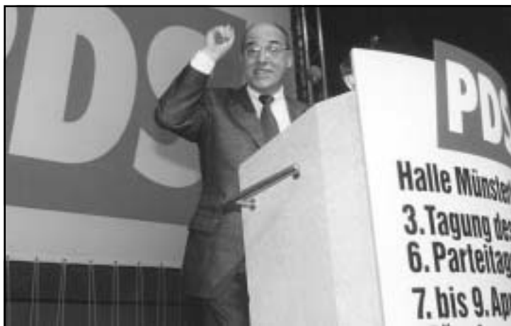
Seine letzte Parteitagsrede? Gysi erklärte in Münster seinen Rückzug als Fraktionschef

Konflikt um Friedenspolitik überschattete Hauptthemen