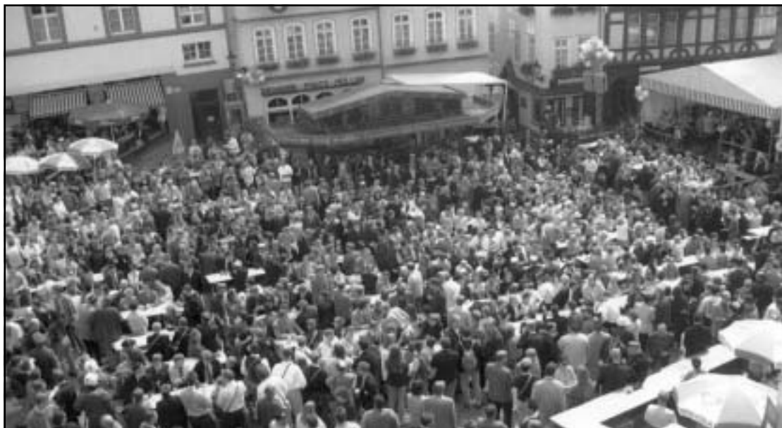
Verfllossene Burschenherrlichkeit: Marktfrühschoppen 1996

PDS Marburg-Biedenkopf Marburger Bank Konto-Nr.: 53 12 43, BLZ: 53 39 0000