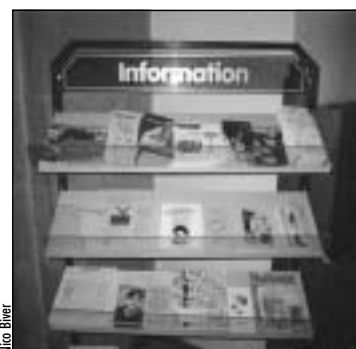
Im Rathaus: keine Infos zur Sozialhilfe

Die PDS/Marburger Linke wird deshalb mit eigenen Mitteln versuchen, die Bevölkerung zu informieren. Dazu zählt die Sozialberatung, die jeden Mittwoch um 18 Uhr in ihrem Büro stattfindet. Artikel in dieser Zeitung werden zumindest einen Teil dessen nachzuholen, was die Stadt versäumt. Heiner Walter