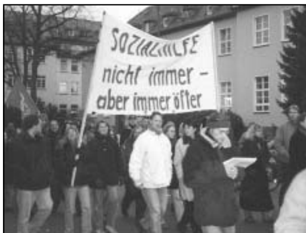
Demo gegen Sozialabbau 1998

Mangelnde Information ist ein Grund dafür. Der andere ist die öffentliche Stigmatisierung derjenigen, die „Stütze“ beziehen, als Faulenzer und Abzocker. Dabei stehen die allermeisten SozialhilfeempfängerInnen dem Arbeitsmarkt gar nicht zur Verfügung. Vierzig Prozent sind Kinder. Einen hohen Anteil machen